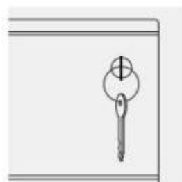
Serratura con chiave e sistema antiribaltamento